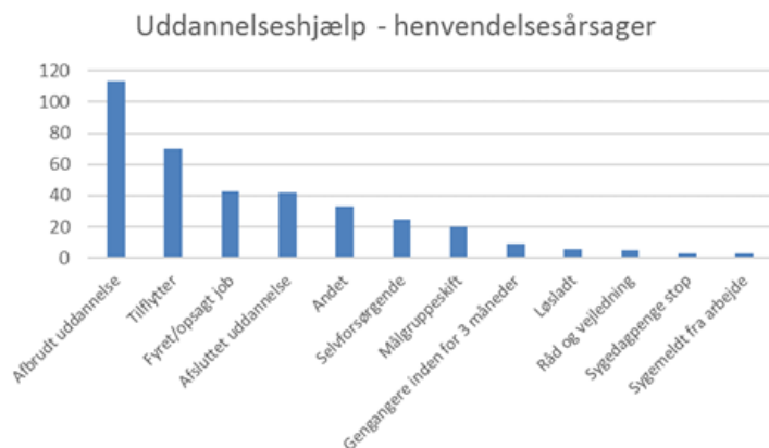
Figur 2 - Antal startede uddannelseshjælpssager i 2018 fordelt på henvendelsesårsager.

Af figur 2 fremgår antallet af nye uddannelseshjælpssager fordelt på henvendelsesårsager.